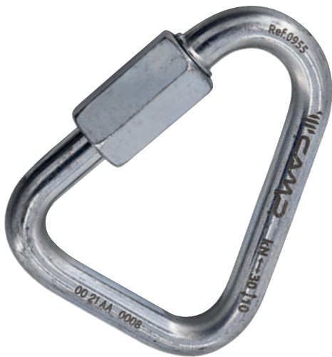
Delta Quick Link Steel 0955 Ø 8 mm

Maglie rapide triangolari, specifiche per la connessione a componenti in fettuccia. Particolarmente adatte all'installazione del bloccante ventrale sulle imbracature per accesso su corda.