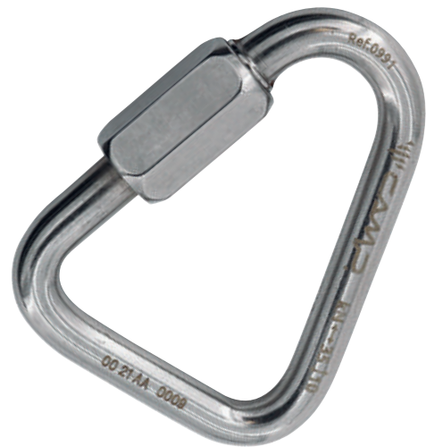
Delta Quick Link Stainless 0991 Ø 8 mm

In acciaio inossidabile, per installazioni esterne o in ambienti corrosivi.