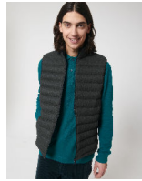
Stanley Climber Wool-Like

Shell : Plain Weave Brushed , 100% poliestere riciclato , Fluorine-free DWR , 140 GSM