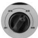
Diversi diametri di accessori selezionabili