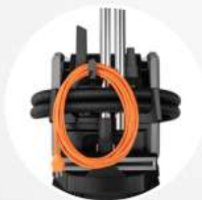
GANCI PORTA ACCESSORI E SOSTEGNO CAVO