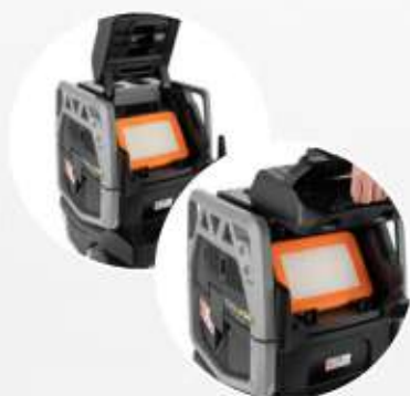
FILTRO PIATTO IN PTFE resistente all'umidità e lavabile.