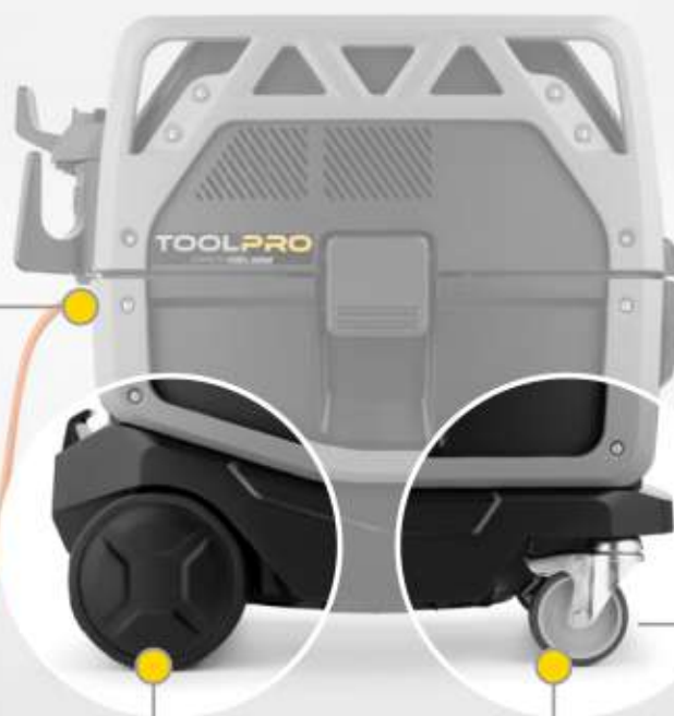
Ruote posteriori grandi: assicurano una maggiore stabilità della macchina.