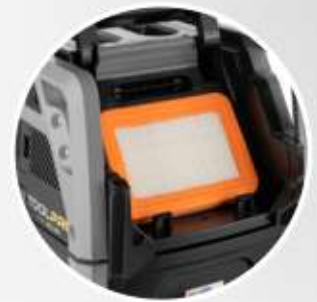
FILTRO PIATTO IN PTFE