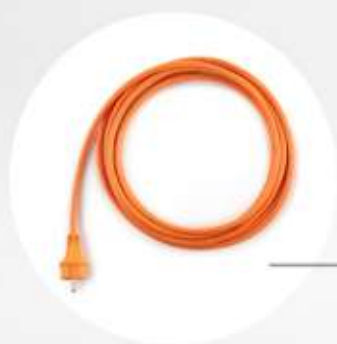
Cavo arancione ad alta visibilità.

LE RUOTE ANTERIORI PIVOTTANTI (Ø 100 MM), ENTRAMBE DOTATE DI FRENO E DI BLOCCAGGIO DIREZIONALE, E QUELLE POSTERIORI GRANDI RENDONO LA MACCHINA ESTREMAMENTE MANEGGEVOLE E PERMETTONO DI LAVORARE AL TEMPO STESSO IN TUTTA SICUREZZA.