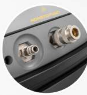
KIT COMBI (OPTIONAL)