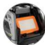
Filtro piatto in PTFE