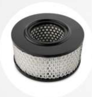
FILTRO CARTUCCIA HEPA