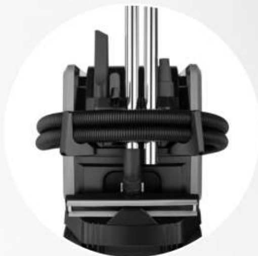
ALLOGGIAMENTI PER IL TUBO