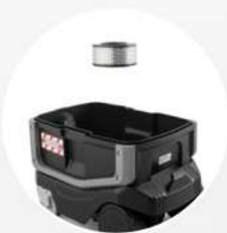
FILTRO CARTUCCIA HEPA per le migliori performance di aspirazione e la massima protezione del motore (in dotazione nella versione H AS).