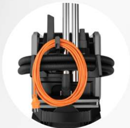
GANCI PORTA ACCESSORI E SOSTEGNO CAVO

IL PRATICO SOSTEGNO CAVO, I GANCI PORTA ACCESSORI E I COMODI ALLOGGIAMENTI PER IL TUBO SONO COLLOCATI SULL'ASPIRATORE. LAVORARE IN MODO RAPIDO E SICURO IN UN AMBIENTE ORDINATO NON È MAI STATO COSÌ SEMPLICE!