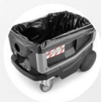
SACCHETTO PE destinato agli impieghi più gravosi (optional).