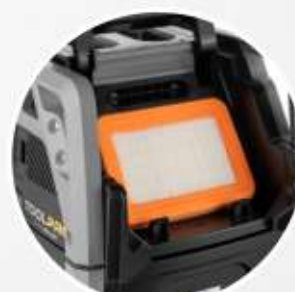
FILTRO PIATTO IN PTFE