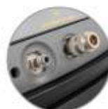
Kit COMBI (optional)