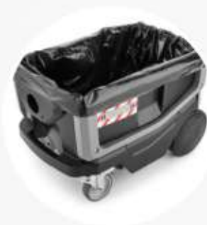
SACCHETTO IN PE (OPTIONAL)