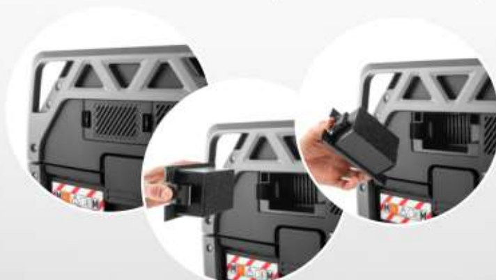
FILTRO ARIA DI RAFFREDDAMENTO per la massima protezione del motore.