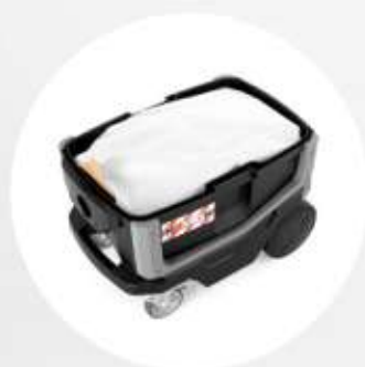
FILTRO FLEECE di grande capacità (20 l).