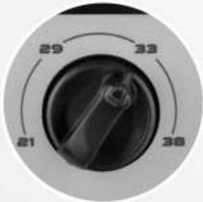
DIVERSI DIAMETRI DI ACCESSORI SELEZIONABILI