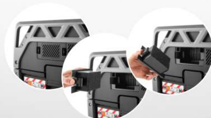
FILTRO ARIA DI RAFFREDDAMENTO per la massima protezione del motore.