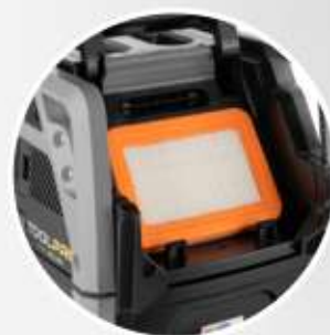
FILTRO PIATTO IN PTFE