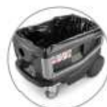
Sacchetto in PE (optional)