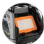
Filtro piatto in PTFE