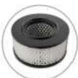
Filtro cartuccia HEPA