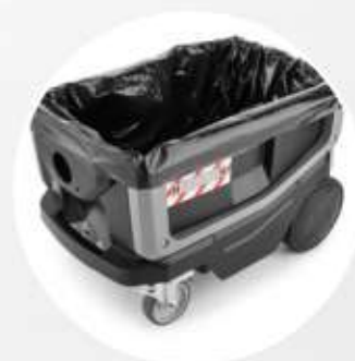
SACCHETTO PE destinato agli impieghi più gravosi (optional).