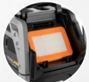
FILTRO PIATTO IN PTFE