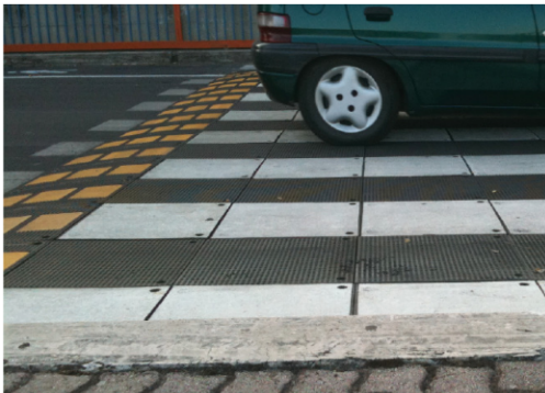
Specifica mattonella e montaggio