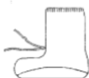
T07SU Antiscivolo millerighe