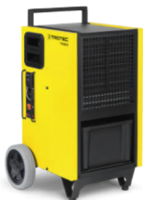
TTK 175 S-355 S-655 S