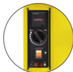
Pannello di controllo - protetto da barre di protezione