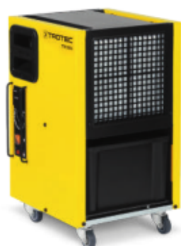
TTK 125 S